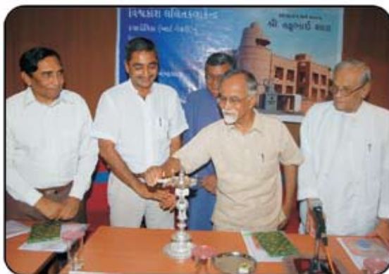
કલાવીચિકાનો દીપ-પ્રાગટ્યથી પ્રારંભ

ગુજરાત વિશ્વકોશ ટ્રસ્ટ વતી મુદ્રક, પ્રકાશક અને તંત્રી કુમારપાળ દેસાઈ, પ્રકાશનસ્થળ : ગુજરાત વિશ્વકોશ ટ્રસ્ટ, ૫૧/૨, રમેશપાર્કની બાજુમાં, બંધુસમાજ સોસાયટી સામે, ઉસ્માનપુરા, અમદાવાદ ૩૮૦ ૦૧૩. ફોન : ૨૭૫૫ ૧૭૦૩, મુદ્રણસ્થળ : ભગવતી ઓફસેટ, બારડોલપુરા, દરિયાપુર દરવાજા બહાર, અમદાવાદ ૩૮૦ ૦૦૪