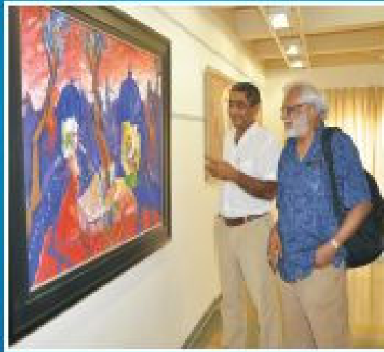
વિશ્વવિહારની સંપાદકોની સાથે સાથે ટ્રસ્ટના સી. જી. જી. અને સી. જી. જી.