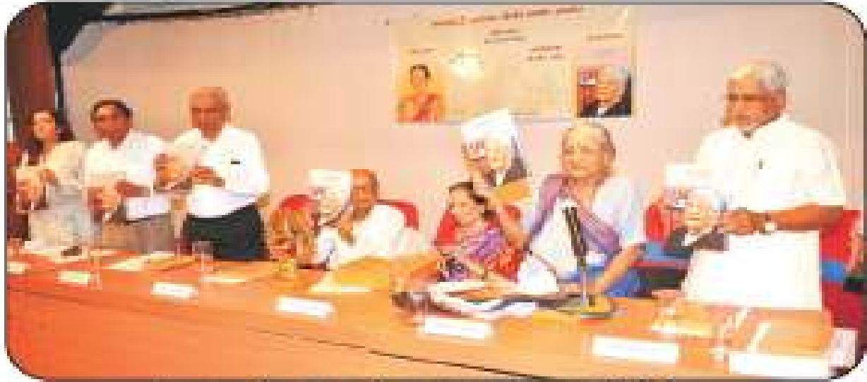
'સવ્યસાગી : સ્મરણદીપના પ્રકાશમાં' પુસ્તકનું વિમોચન