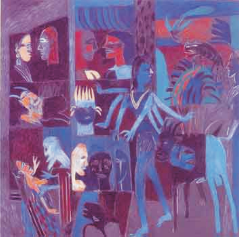
કે. જી. સુબ્રહ્મણ્યમની કલાકૃતિ

ગુજરાત વિશ્વકોશ ટ્રસ્ટ વતી મુદ્રક, પ્રકાશક અને તંત્રી કુમારપાળ દેસાઈ, પ્રકાશનસ્થળ : ગુજરાત વિશ્વકોશ ટ્રસ્ટ, ૫૧/૨, રમેશપાર્કની બાજુમાં, બંધુસમાજ સોસાયટી સામે, ઉસ્માનપુરા, અમદાવાદ ૩૮૦ ૦૧૩. ફોન : ૨૭૫૫ ૧૭૦૩, મુદ્રણસ્થળ : ભગવતી ઑફસેટ, બારડોલપુરા, દરિયાપુર દરવાજા બહાર, અમદાવાદ ૩૮૦ ૦૦૪