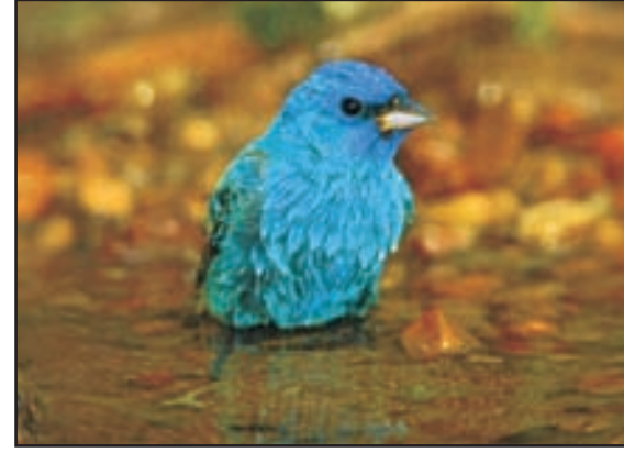
આ પક્ષીનો રંગ શા કારણે ?

email : vishvakoshad1@gmail.com ♦ www.vishvakosh.org છૂટક કિંમત રૂ. ૧૦/-, વાર્ષિક લવાજમ રૂ. ૧૦૦/-, ત્રણ વર્ષનું લવાજમ રૂ. ૩૦૦/- લવાજમ: 'ગુજરાત વિશ્વકોશ ટ્રસ્ટ'ના નામે ડ્રાફ્ટ અથવા મ. ઓ.થી જ મોકલવું. [અહીં પ્રગટ થતાં લખાણોમાંના વિચાર-અભિપ્રાયની જવાબદારી જે તે લેખકની છે.]