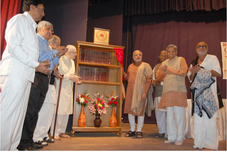
ગુજરાતી વિશ્વકોશના 25મા ખંડ અને બાળવિશ્વકોશના પ્રથમ ખંડની વિમોચન-વિધિ (15 ડિસેમ્બર, 2009)