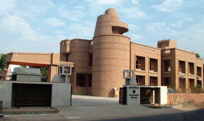
उस्मानपुरा विस्तारमां आवेलुं विश्वकोशभवन