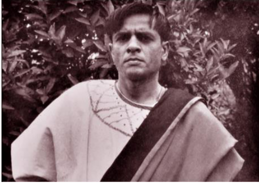
સાડત્રીસ વર્ષની વયે જુલિયસ સીઝરની ભૂમિકામાં