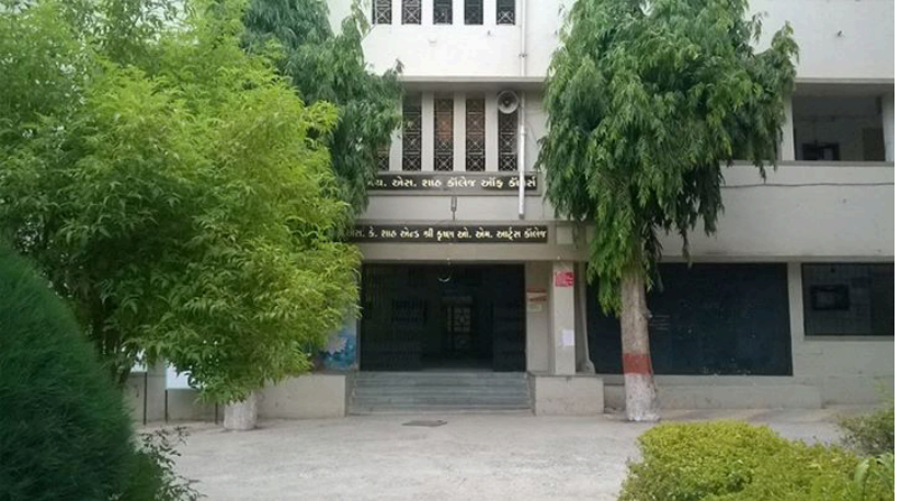
મોડાસાનું શૈક્ષણિક સંકુલ