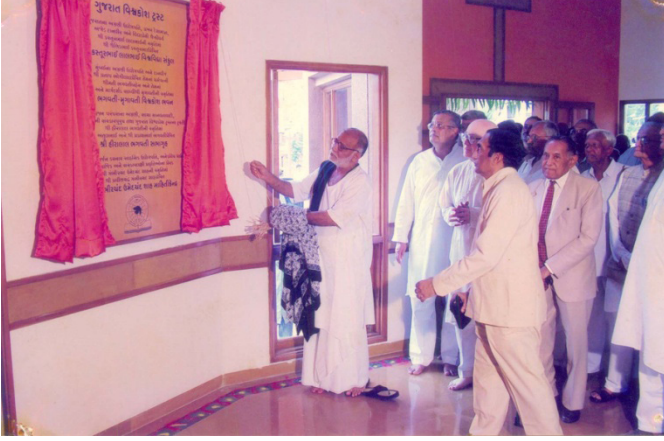
विश्वकोशना विविध संकुलोनुं उदघटन करता पूज्य मोरारिबापु