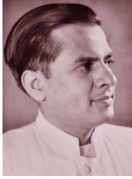
તેત્રીસ વર્ષની વયે